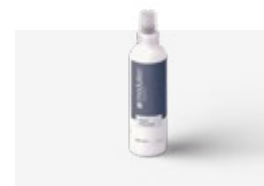
Vlekkenverwijderaar 250 ml MODSPOTCLEAN