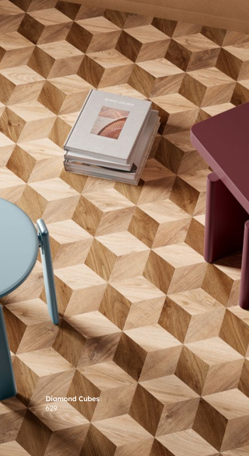
Diamond Cubes 629