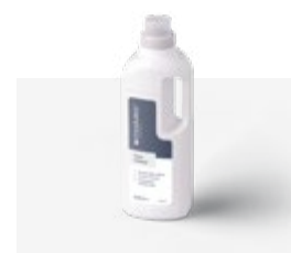
Vloerreiniger 1 liter MODCLEANECO1000